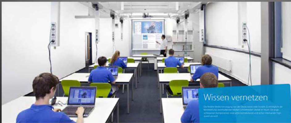
Flexible Einrichtung von Fachräumen mit Deckensystemen